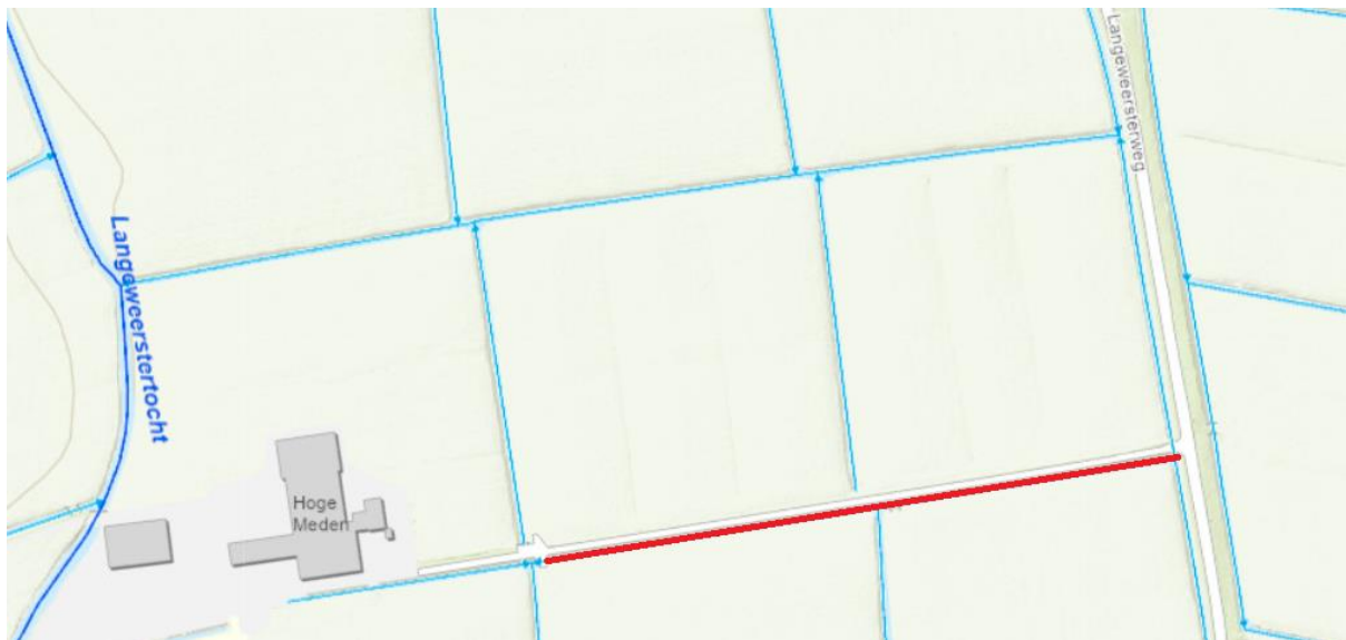
Figuur 1: locatie van de demping.

Het dagelijks bestuur van het waterschap Noorderzijlvest heeft op 30 augustus 2021 van een aanvraag ontvangen om een vergunning als bedoeld in hoofdstuk 6 van de Waterwet (Wtw). De aanvraag betreft het dempen van een secundaire watergang nabij Langeweesterweg 3 te Den Horn, zoals hieronder globaal is weergegeven in de figuren 1 en 2.