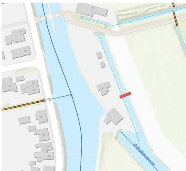
Figuur 2: locatie van de tijdelijke dam ter plaatse weergegeven in het rood.