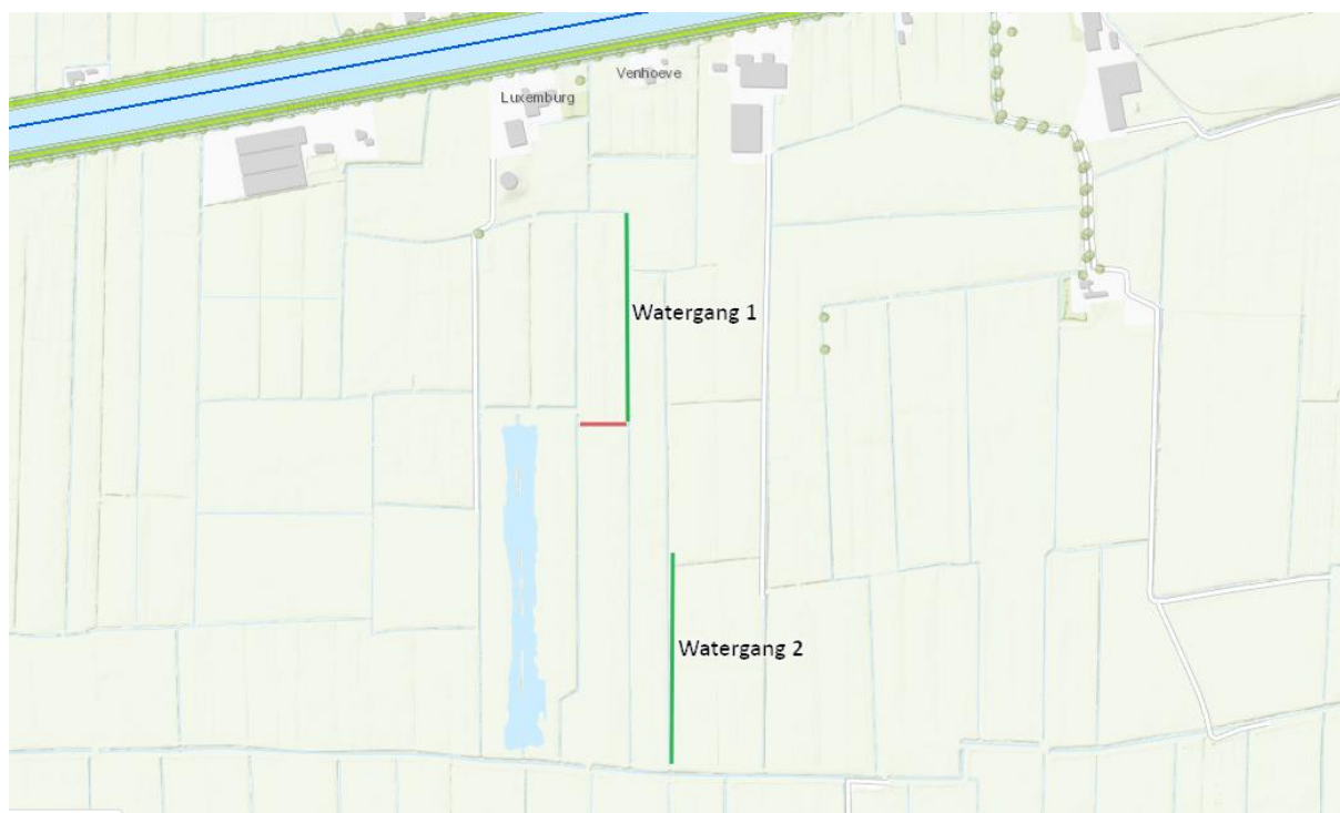
Figuur 1: Bovenstaande kaart geeft globaal het werkgebied weer. De rode lijn geeft de te dempen watergang weer. De groene lijnen geven de te verbreden watergangen weer.