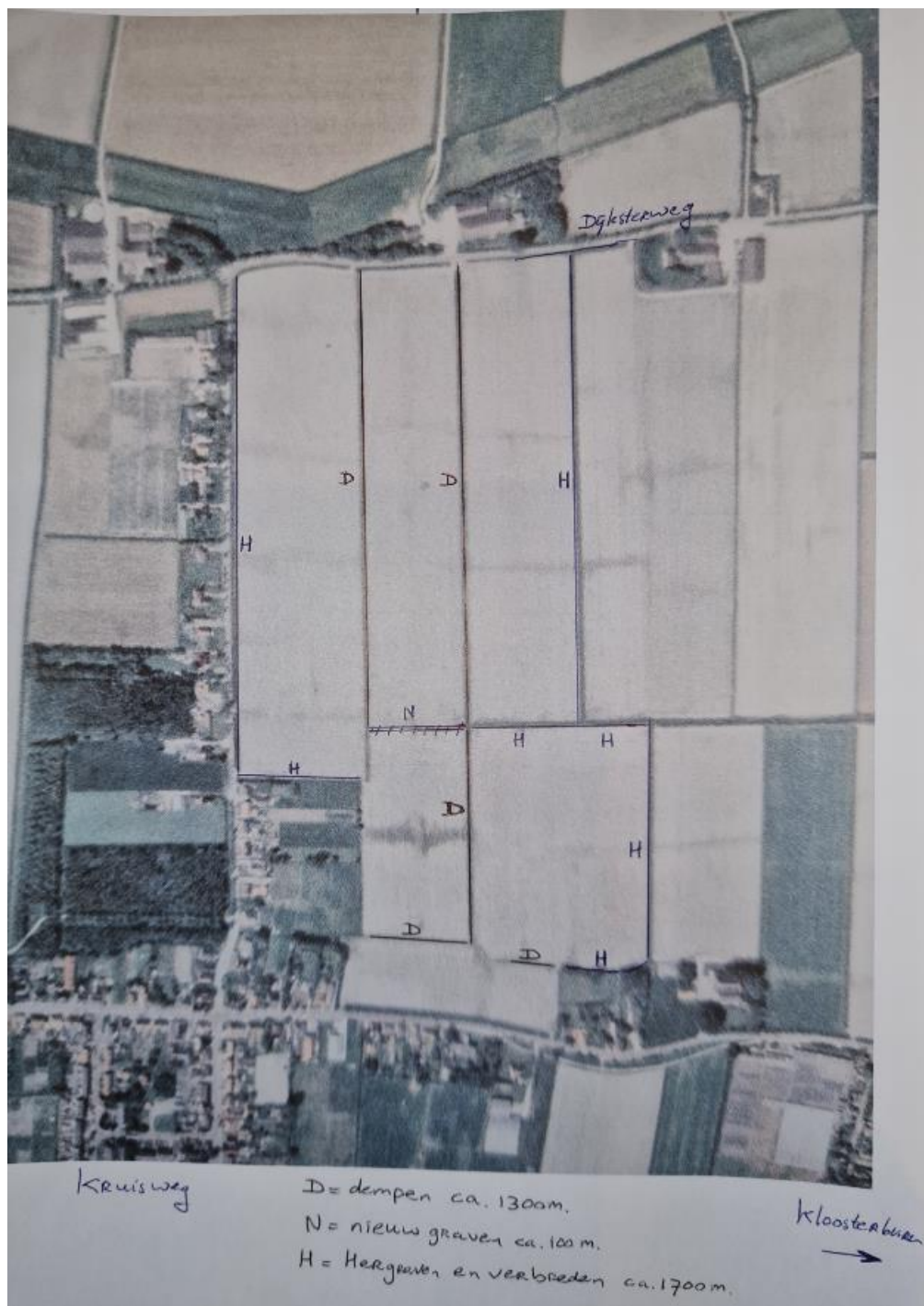
Figuur 1: locatie van de werkzaamheden met activiteiten.