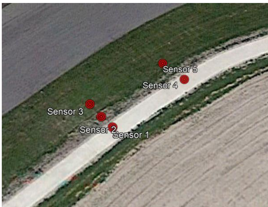
Figuur 3c: detail van de locatie van de werkzaamheden die plaatsvinden in de Borkumkade.