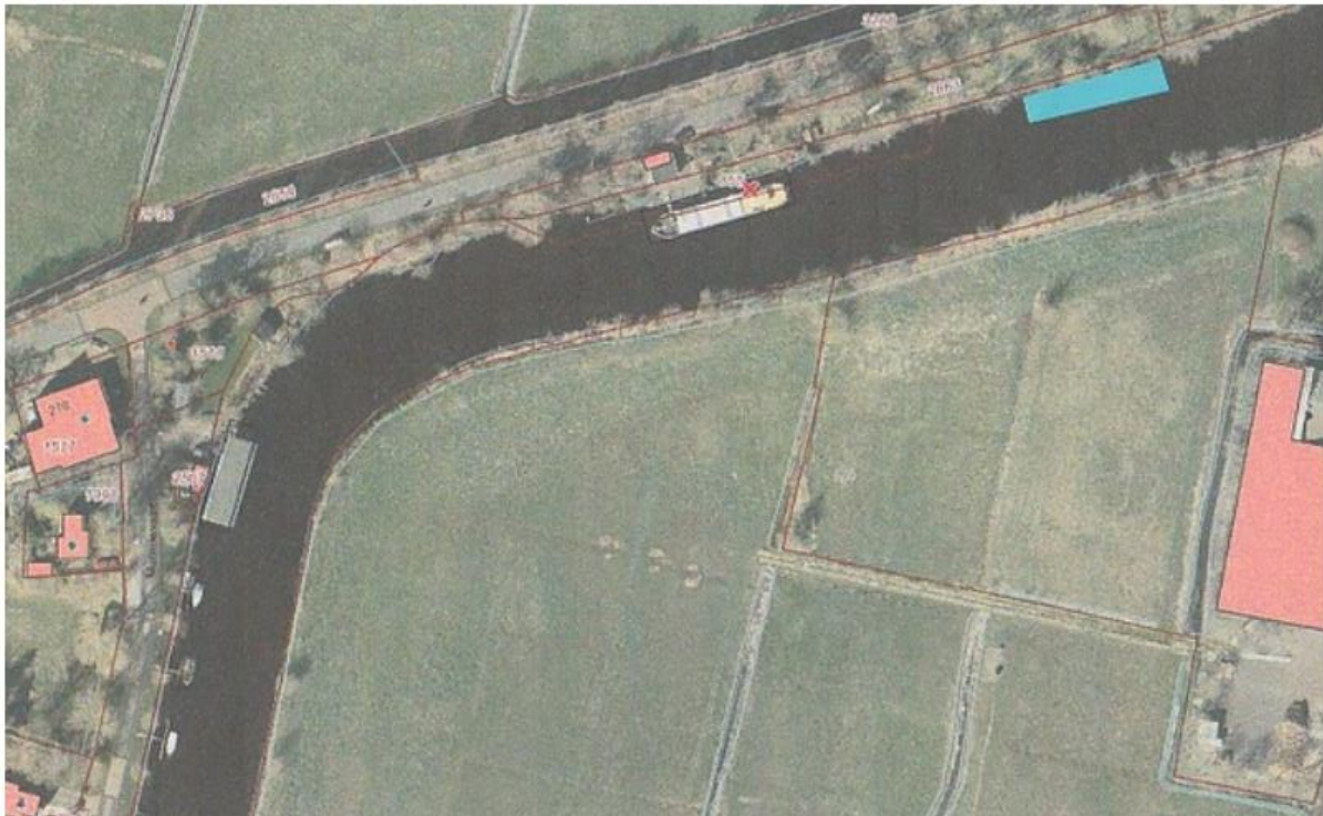
Figuur 1: In het blauw de beoogde ligplaats voor een woonschip

De locaties waarvoor vergunning wordt gevraagd liggen in en langs de Gave tussen Hoofdstraat 270A en 270B te Oostwold, zoals hieronder is weergegeven in figuur 1 en 2.