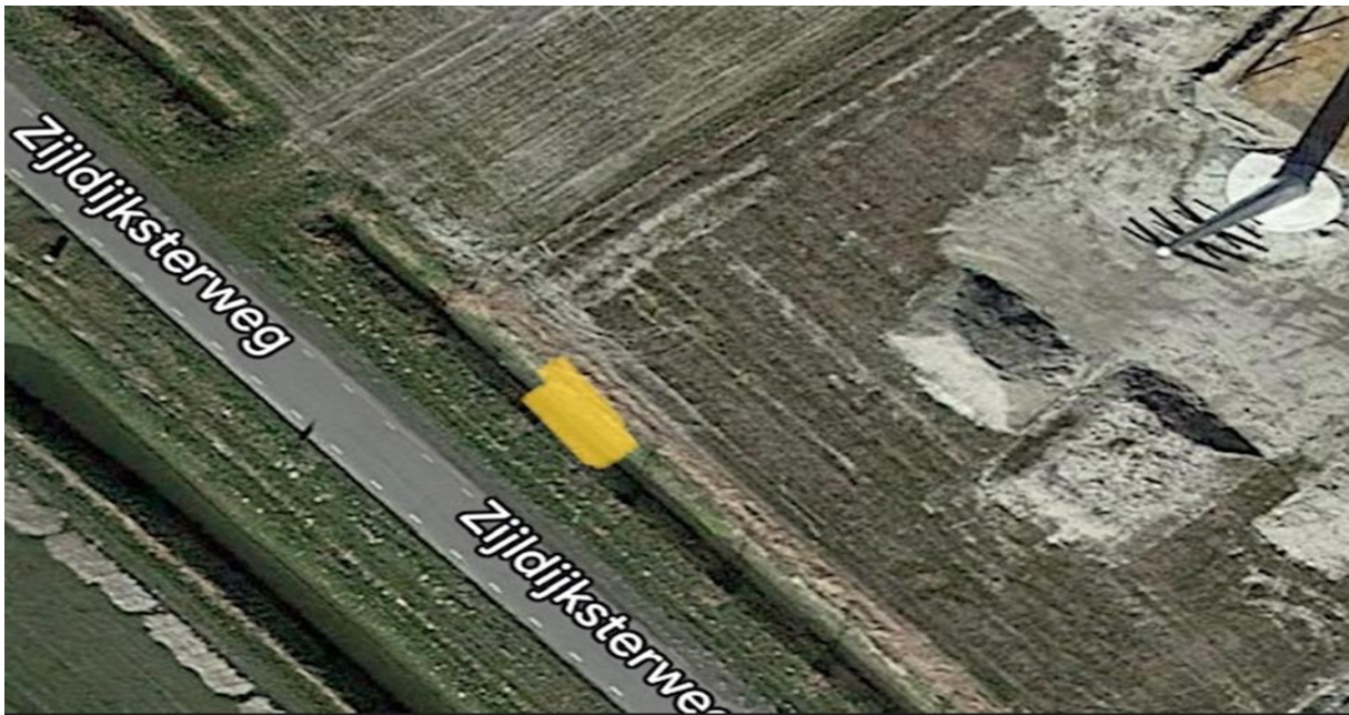
Figuur 2: Locatie aan te leggen dam met duiker aangegeven met gele vlak.