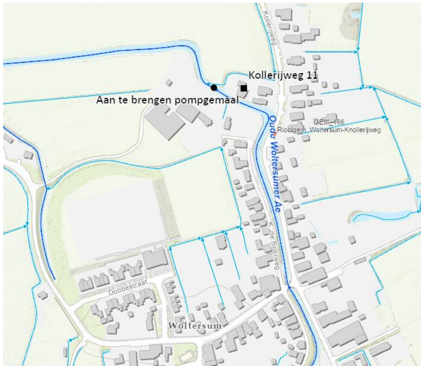
Figuur 1: Aan te brengen pompemaal (zwart rondje) nabij Kollerijweg 11 te Woltersum

Het dagelijks bestuur van het waterschap Noorderzijlvest heeft op 3 december 2021 van een aanvraag ontvangen om een vergunning als bedoeld in hoofdstuk 6 van de Waterwet (Wtw). De aanvraag betreft het aanbrengen van een pompemaal bij een stuw binnen de kernzone van een hoofdwatgang nabij Kollerijweg 11 te Woltersum, zoals hieronder globaal is weergegeven in figuur 1.