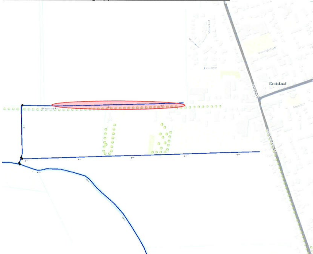
Afb. 1: Locatie verbreding oppervlaktewaterlichaam OVK04566

Categorie A oppervlaktewaterlichaam (OVK04566) is in onderhoud bij het Waterschap Brabantse Delta. In afbeelding 1 word de locatie weergegeven.