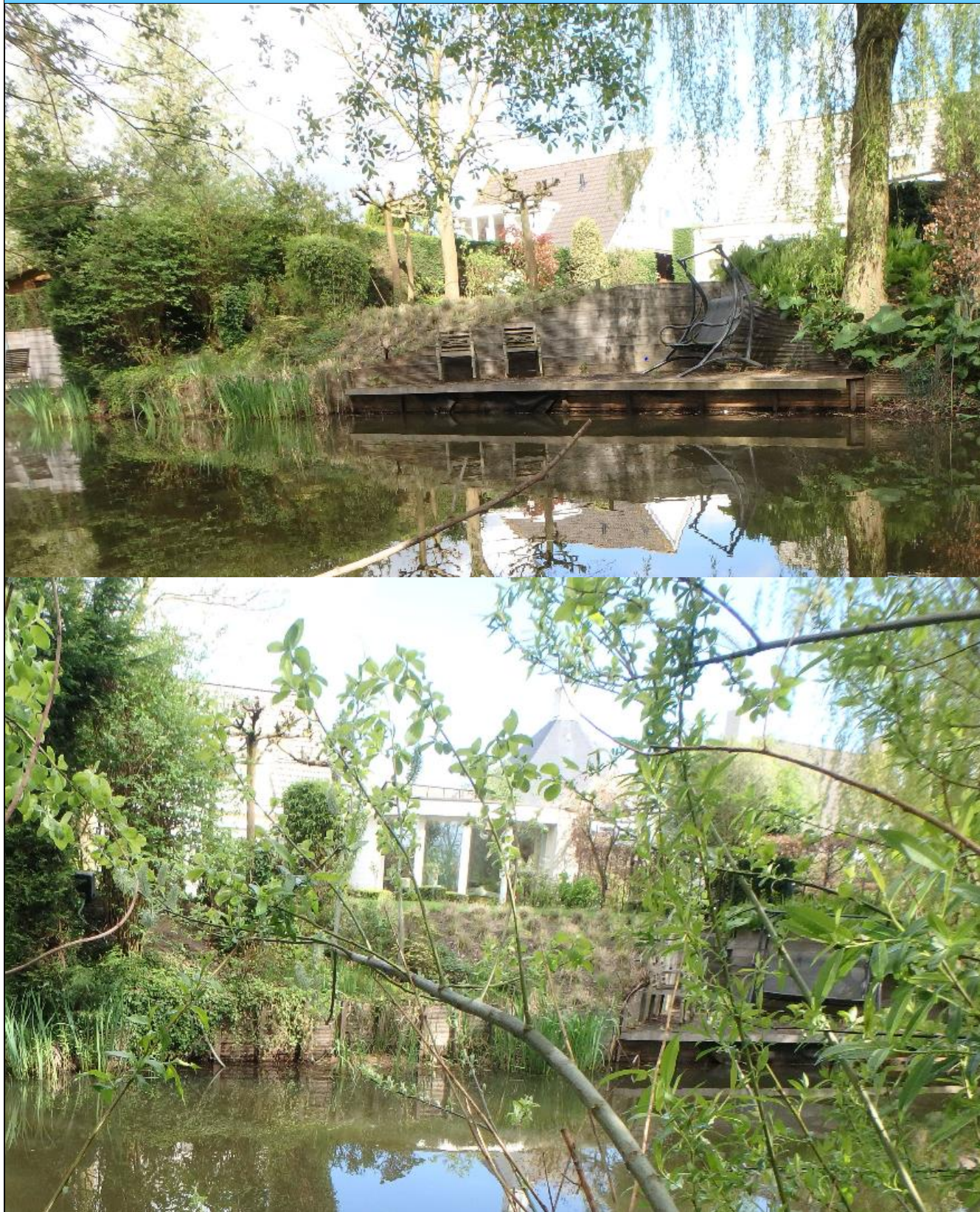
Foto behorende bij de vergunning voor het hebben en onderhouden van: