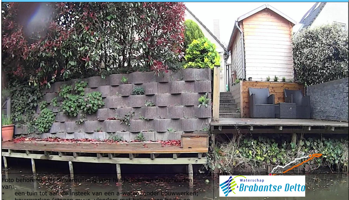
Foto behorende bij de vergunning voor het hebben en onderhouden van: