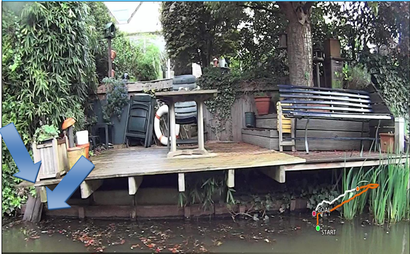
Foto behorende bij de vergunning voor het hebben en onderhouden van: