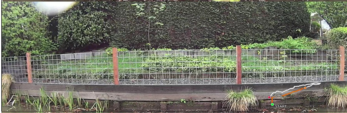
Foto behorende bij de vergunning voor het hebben en onderhouden van: