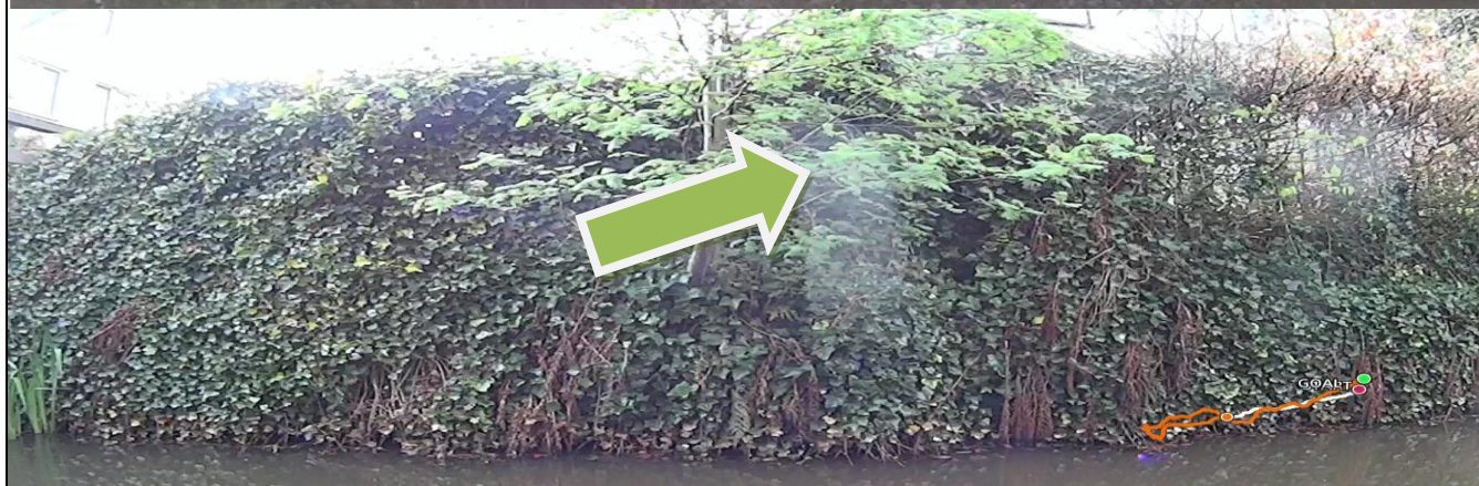
Foto behorende bij de vergunning voor het hebben en onderhouden van: