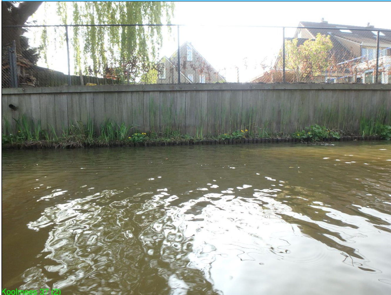
Koolmees 37 (2)

Luchtfoto/situatietekening behorende bij de vergunning voor het hebben en onderhouden van: