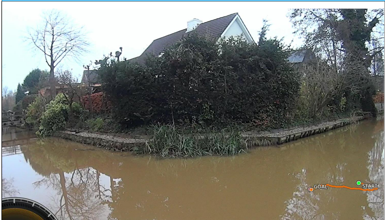
Foto behorende bij de vergunning voor het hebben en onderhouden van: