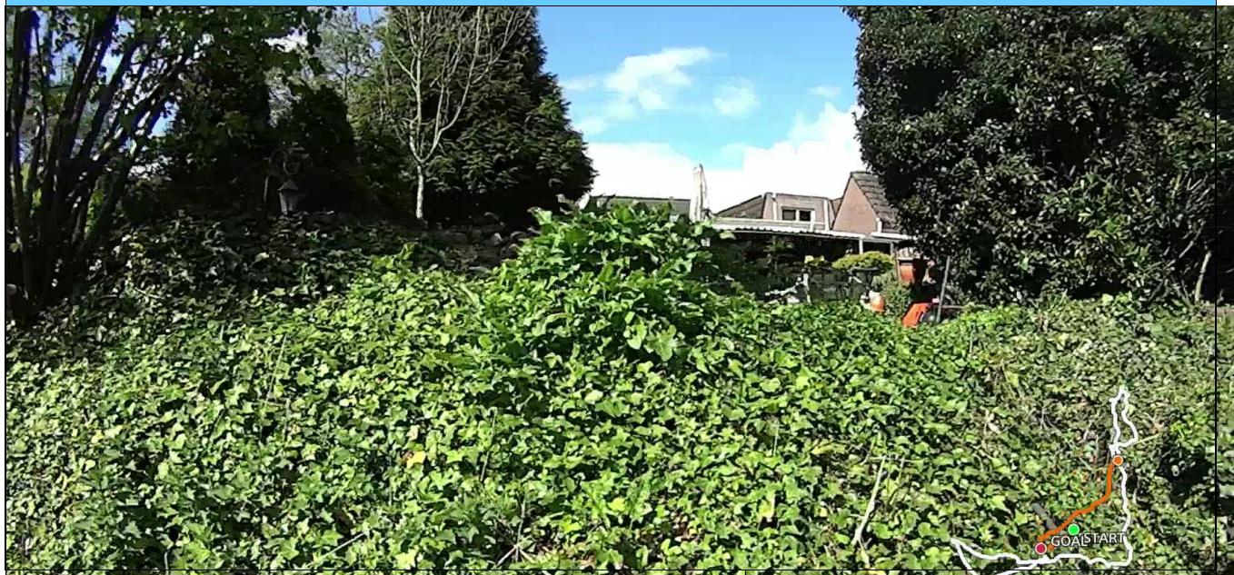
Foto behorende bij de vergunning voor het hebben en onderhouden van:

* een tuin (hieronder wordt verstaan: beplanting/bomen) tot aan de insteek van een a-water zonder bouwwerken; in de beschermingszone van het a-water met leggercode OVK05523 op het perceel kadastraal bekend als gemeente Nieuw-Vossemeer, sectie B, nummer 1079.