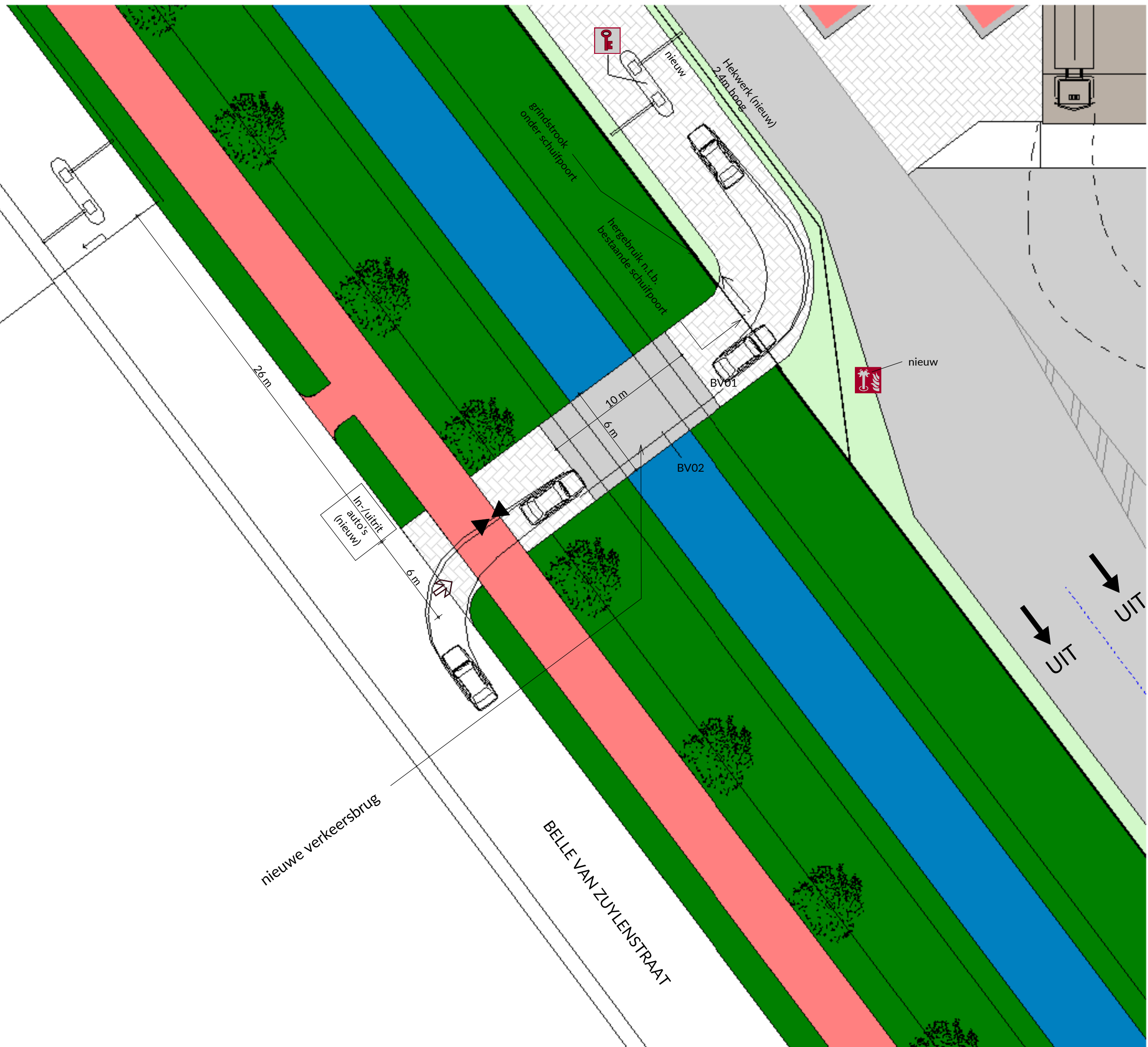
Terrein uitsnede 1:200

Leverancier: Haitsma beton o.g. Type: Haitsma Korte Overspanning (HKO-ligger) Wegbreedte: 6 meter (6x990mm1) Overspanning: 10 meter (in het werk na te meten)