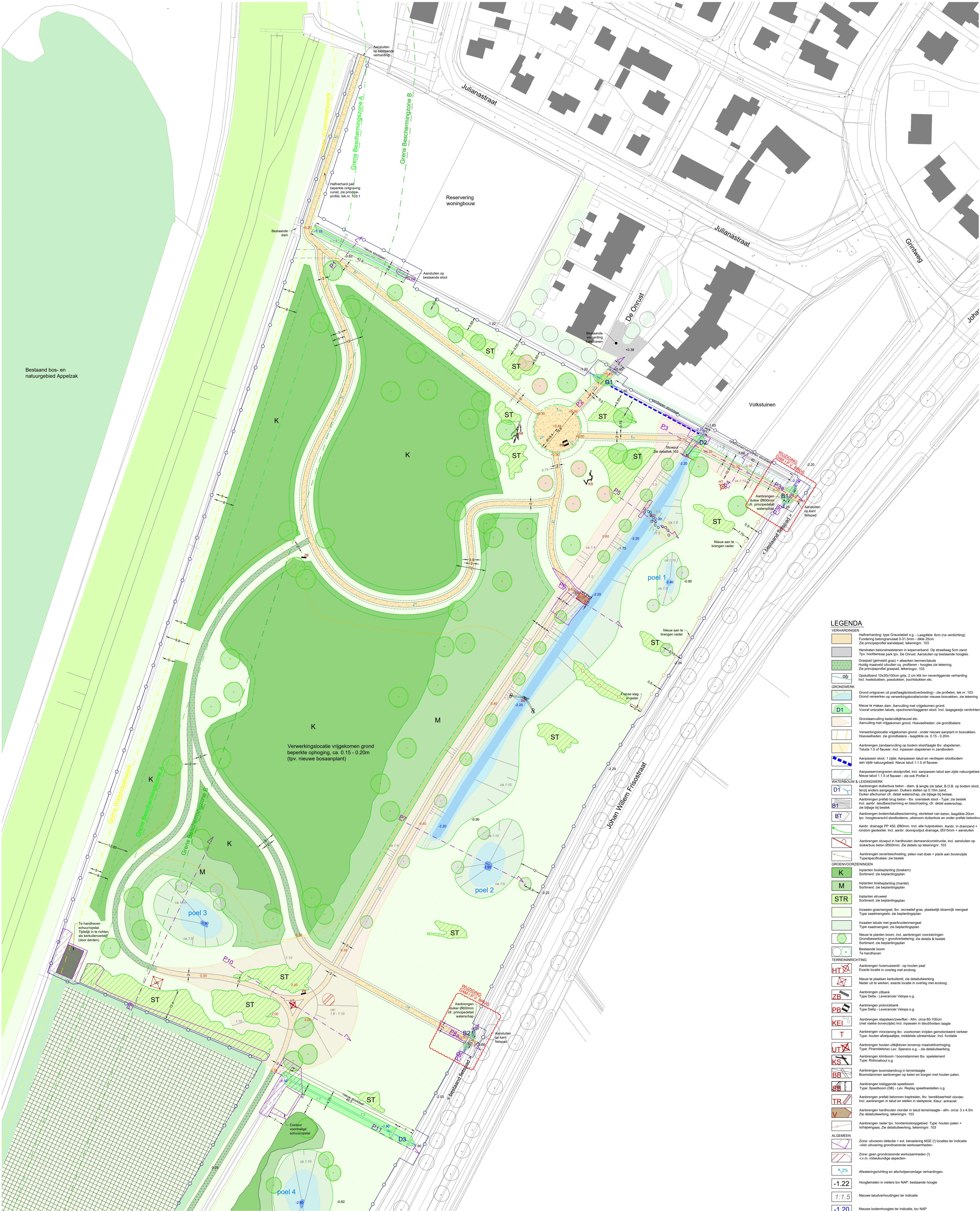
v - Zuidelijk deel, zie tekening 102.2 - v