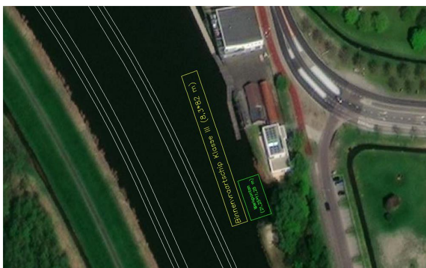
Figuur 3: Situatie met breder werkponon werkzaamheden Roeivereniging (DG5) - zuidzijde