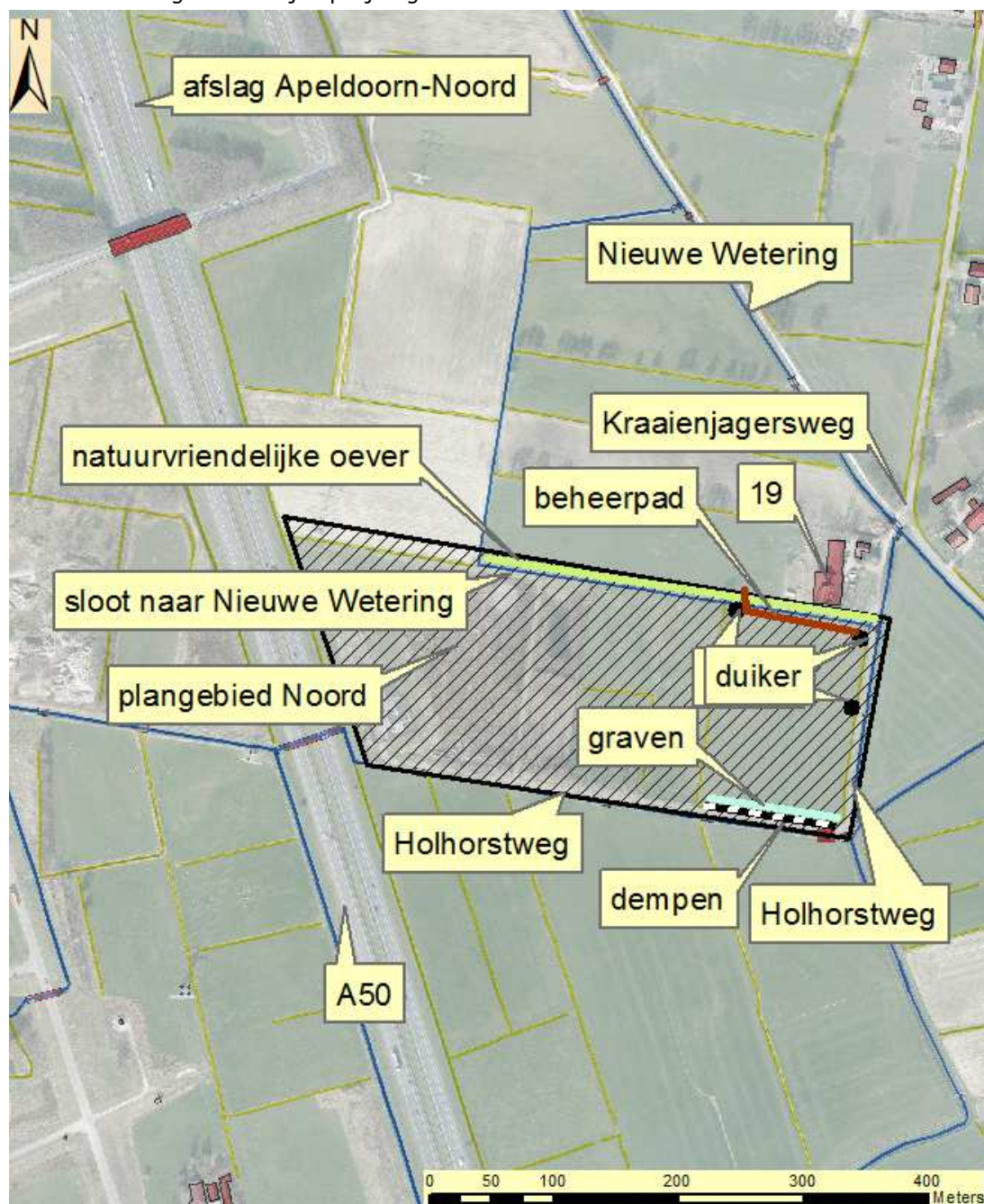
Situatietekening: noordelijke projectgebied