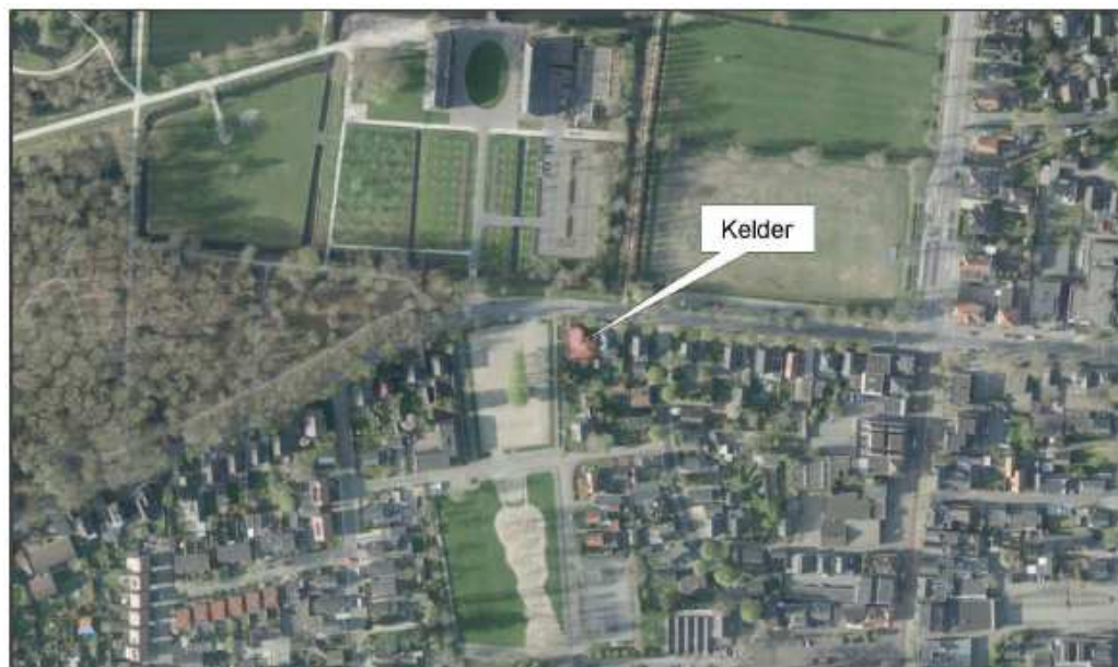
Figuur 2 - Projectlocatie ingezoomd