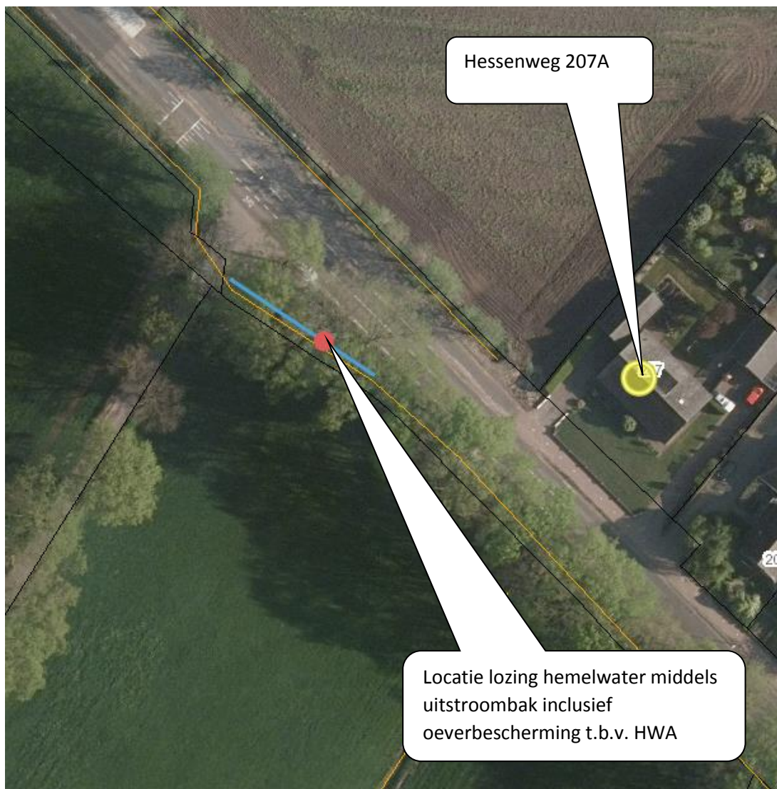
Figuur 1 locatie lozing hemelwater middels uitstroombak inclusief oeverbescherming