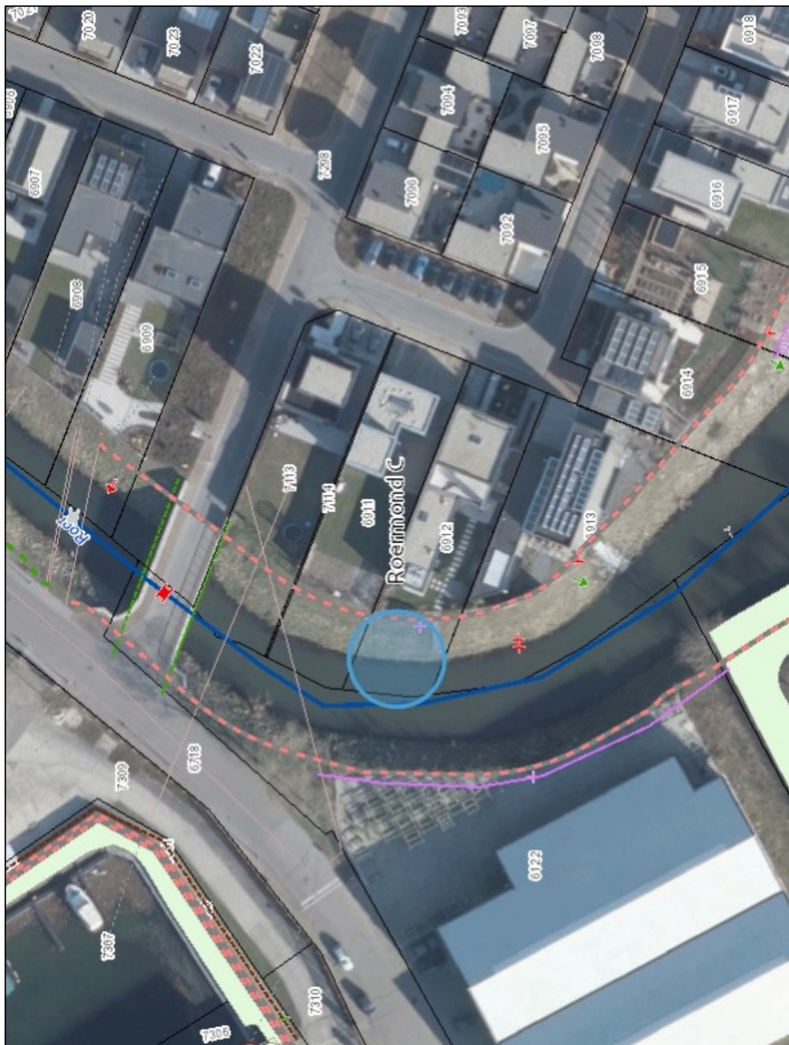
Bijlage 1: locatie van de steiger bij de Roer