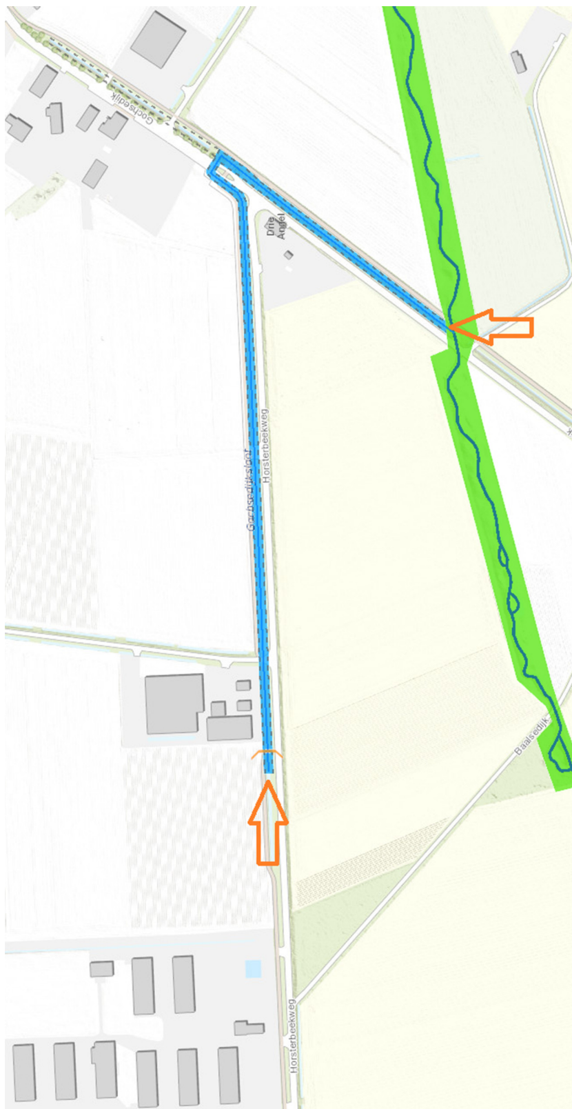
Kaart 2: Gochsedijksloot: overdracht beheer en onderhoud