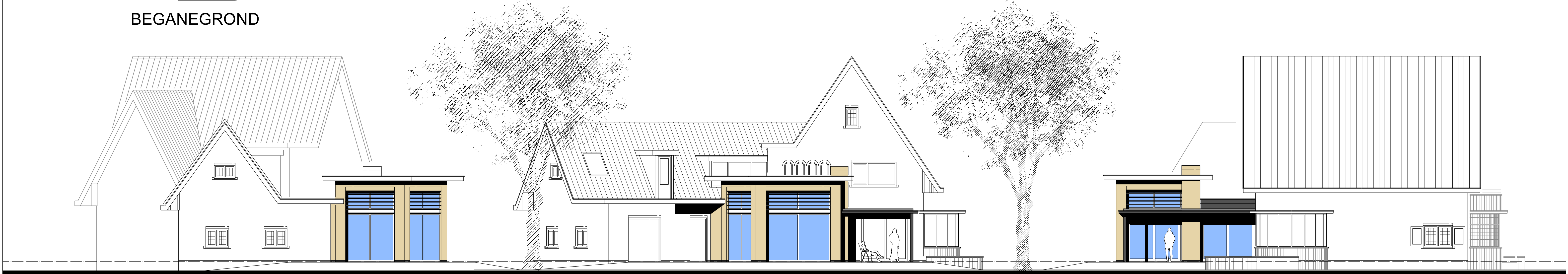
RECHTERAANZICHT 'OUDE PRAKTIJK'