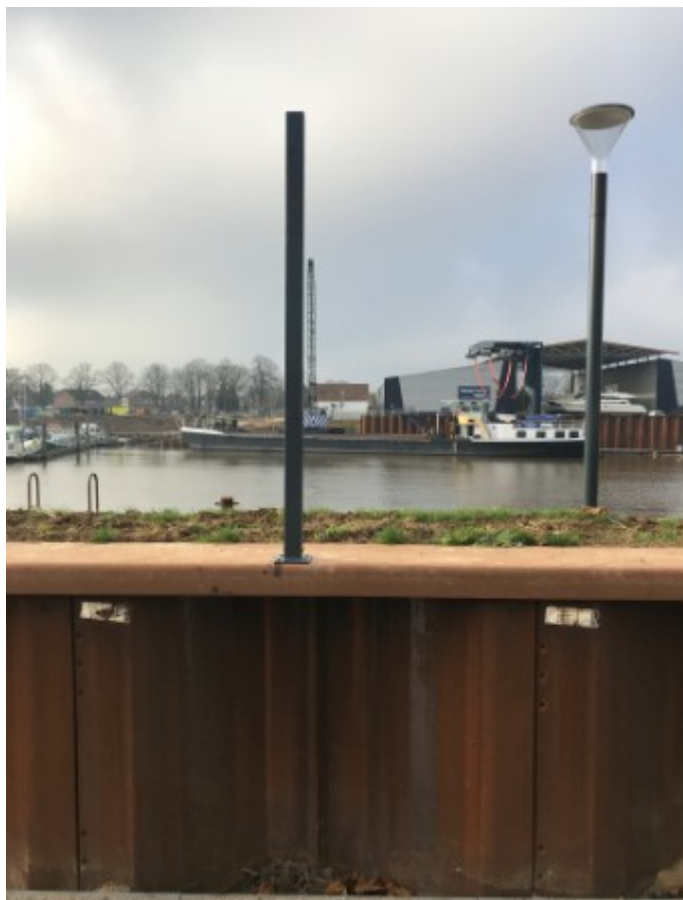
bijlage 2: foto 'deksloof'