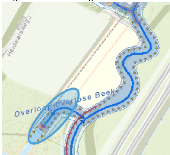
Afbeelding: verhogingsgebied met de brug