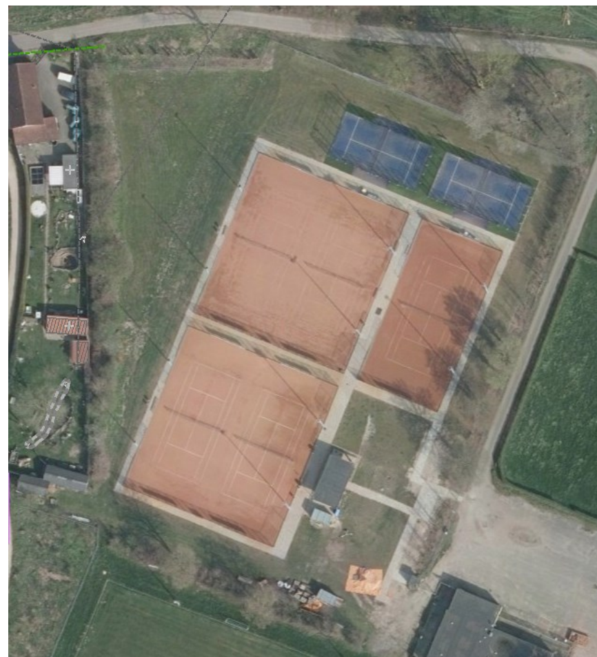
Luchtfoto (feb 2020)