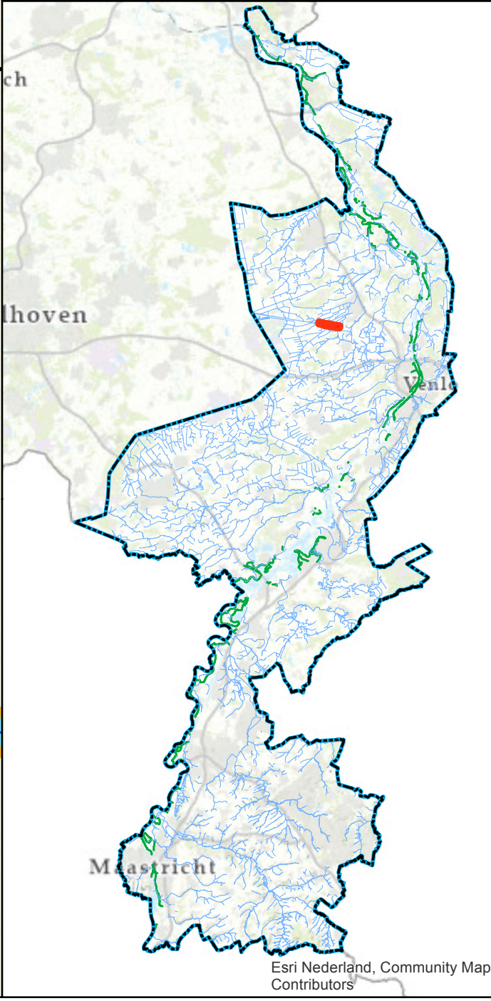
Overzichtskaartje (schaal 1:650.000)