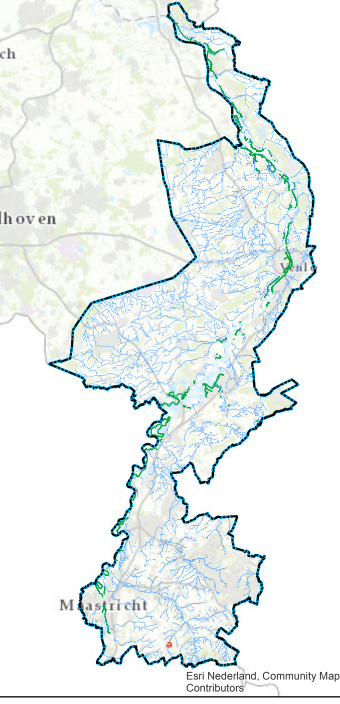
Overzichtskaartje (schaal 1:650.000)